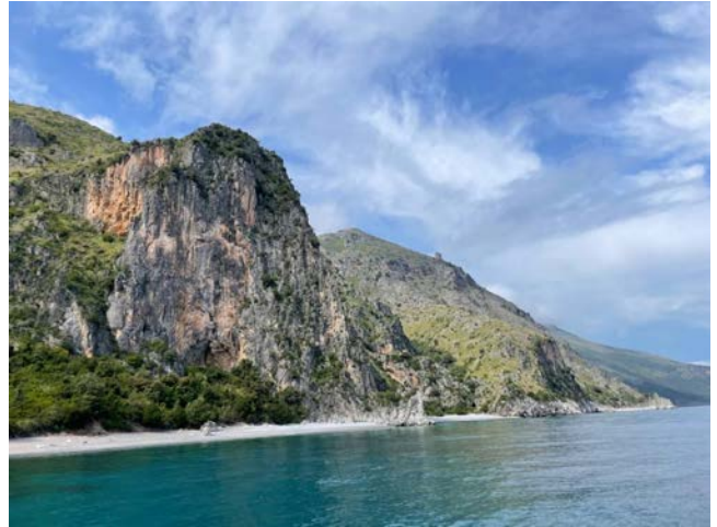
Ongerepte kust van Cilento