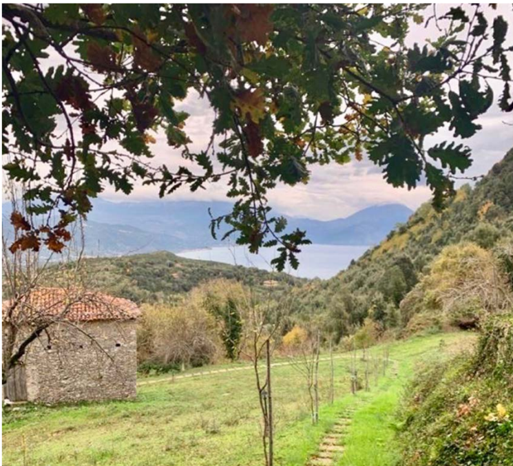
Rondom een hele grote tuin en uitzicht op zee!