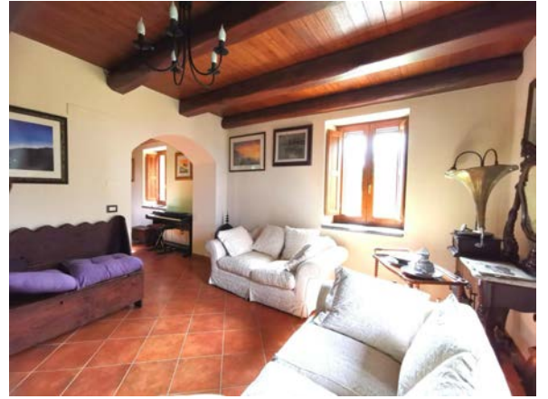
Prachtig authentiek huis